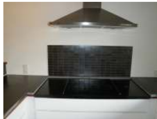
30 - Den færdige stækplade Før havde familien ingen stækplade bag kogepladerne hvilket gjorde det svært at holde væggen ren.