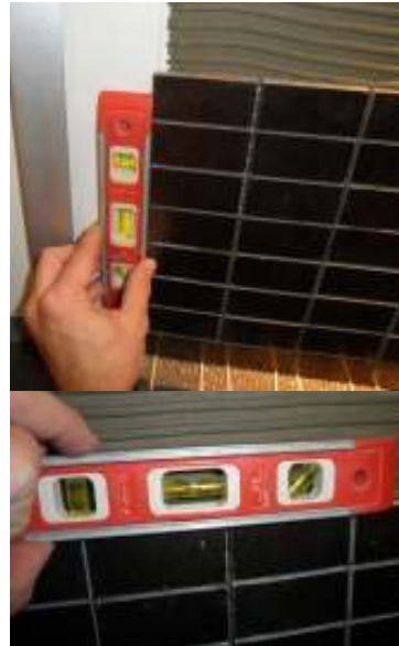
28 - Tjek løbende Der tjekkes løbende at nettene med mosaikker sidder præcist.