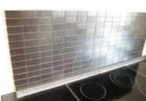
29 - Flot ny overflade Her ses tydeligt det flotte farvespil de sortblanke mosaikker giver i dagslys.