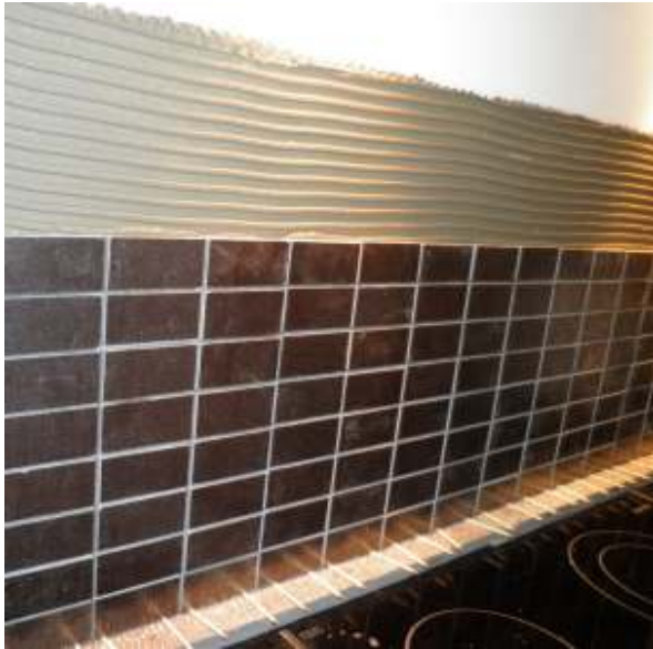
27 - Væg bag komfur / Stækplade På væggen bag kogepladerne monteres ligeledes samme mosaikker.